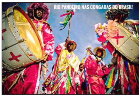
Rio Pandeiro: direto do Rio para Lambari!

Em breve divulgaremos a nossa agenda de eventos para 2017!