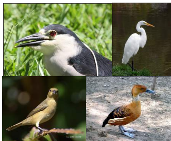
Você sabe quais são as aves que frequentam a cidade?