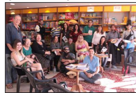
Escritores da região se reuniram no I FLAVIR!