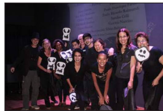
O Coro Cênico do Vagão 98 encena “Ghost”!