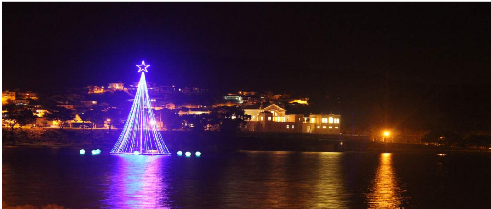
A Árvore de Natal Flutuante brilha no Lago Guanabara, junto ao histórico Casino: lambarienses e turistas prestigiaram a inauguração.

A inauguração da árvore da AMEL foi um verdadeiro sucesso. As mil lâmpadas de LED e as oito esferas de fibra brilharam em harmonia, iluminando com um azul resplandecente uma grande extensão do Lago Guanabara. A contagem regressiva e o acionamento das luzes da árvore emocionaram muitas pessoas que estavam presentes e, segundo se soube, até lágrimas rolaram de alegria em algumas faces.