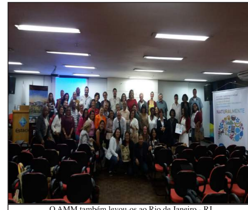
O AMM também levou-os ao Rio de Janeiro - RJ