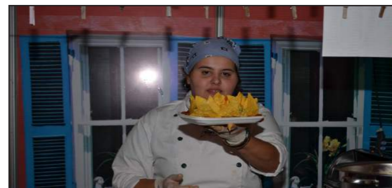
Chapulin: A cozinha mexicana estava bem representada no festival. A Chapulin serviu tacos, nachos e o delicioso Burrito à Mineira, 4º lugar no Concurso Gastronômico.