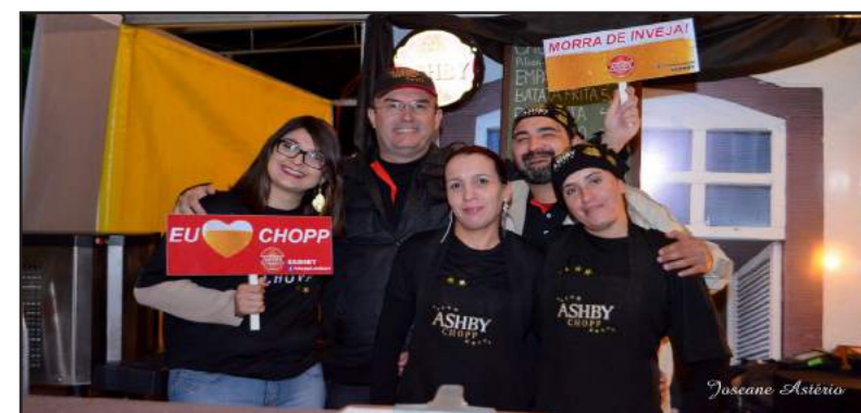
Lá Em Casa: A proposta desse ano foi apostar na novidade e também na tradição. Com isso, surgiu o delicioso prato Empanadas Argentinas, com recheio de Costela e Mandioca servida com conserva especial da casa.