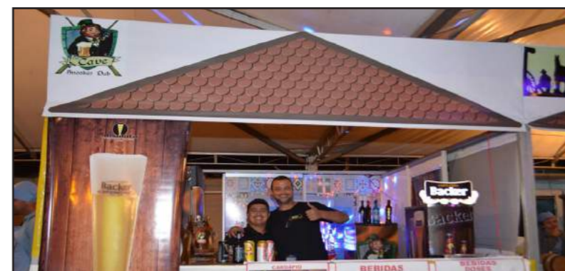
The Cave Pub: Estreante no Festival, o The Cave Pub optou pelo chopp e por servir deliciosos petiscos. A Picanha Suína ao Forno com Mandioca Crocante, carro chefe da tenda, estava sensacional.