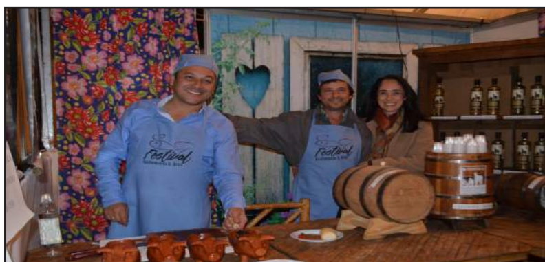
Rancho JS: O Rancho JS mais uma vez esteve presente no Festival. Além da excelente cachaça de fabricação própria, trouxe os deliciosos defumados. Um deles, o Flambado de Costela Suína à Moda do Rancho, foi muito apreciado pelos visitantes e conquistou o segundo lugar no Concurso.