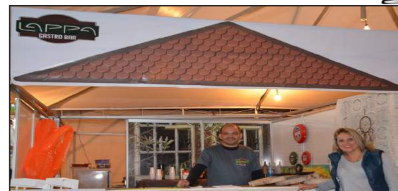
Lappa Gastro Bar: O cardápio deste bar recém, chegado à cidade, teve os petiscos cariocas como carro chefe. Porém, o mineiríssimo Tropeiro do Lappa ganhou o paladar do público.