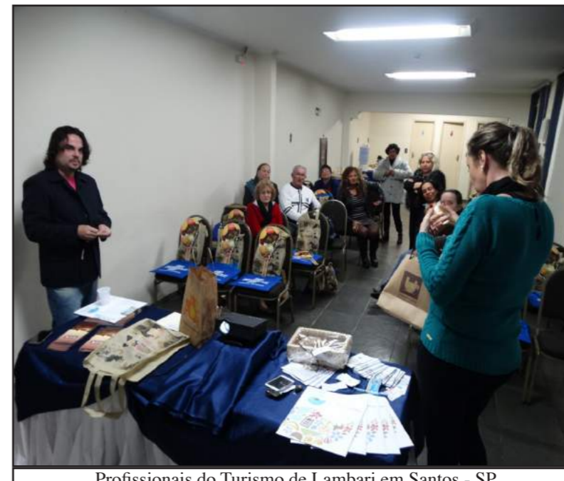
Profissionais do Turismo de Lambari em Santos - SP

ACIL-CDL, que além de servir como sede para seu planejamento e execução, também disponibilizou dois de seus diretores para serem secretário e tesoureiro do projeto. Se seu negócio pode ser beneficiado pela melhora do nosso turismo, venha se juntar a este projeto que o SEBRAE está desenvolvendo em sete cidades da nossa região.