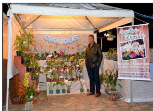
Artesanatos e Orquídeas: A ASCAL e a Artesanato & Tal fizeram uma exposição belíssima e elogiada.