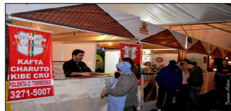
Restaurante Calabrezza: Serviu pratos da culinária árabe, como Kafta, Charuto de Repolho e Kibe Crú, mas foi o Sushi Caipira que chamou atenção pela qualidade e ousadia, tornando-se o prato mais votado pelo público e o campeão do III Concurso Gastronômico.