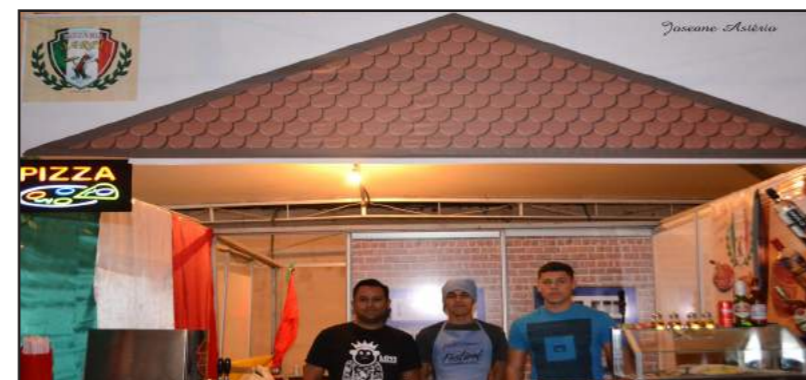
Família Sarpi: Trouxe as deliciosas pizzas servidas no restaurante. Como novidade, trouxe a Pizza Gostinho da Roça, que conquistou o terceiro lugar do Concurso deste ano.