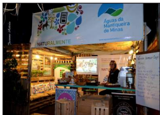
Tenda “Vamos Comer Café”: Iniciativa da AMM e da ISFULMINAS que serviu doces e pães feitos de café.

“Vamos comer café?”. Nesse ano, a instituição beneficiada foi o Sítio Esperança, que recebeu 130kg de alimentos doados na entrada do evento na noite de quinta-feira (21/07). As atrações musicais animaram todos os dias da festa, com as bandas DRW Acústico, Bebeto Castilho, Moderatto, Chico Botelho & Banda e Quarteto WS, tocando jazz, rock, MPB, pop e blues. Que venha a edição 2017!