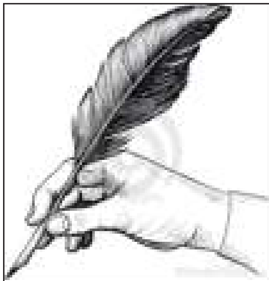
Concurso de Redação: "Lambari Cidade Limpa"