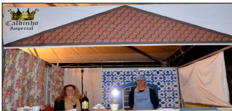
Caldinho Imperial: Tenda especialmente criada para o Festival. Serviu deliciosos caldos, tendo como principal o Thy com Toque de Minas, que virou uma das sensações do evento.