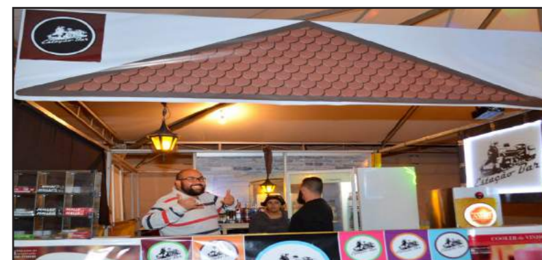
Estação Bar: Pela 2ª vez no Festival, serviu sanduíches gourmets e chopp, além de um delicioso churrasco no domingo. O prato Linguíça Suprema, que continha catupiry, foi muito votado pelo público.