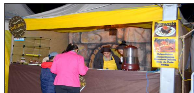
Quel's Petit: Tenda criada para o Festival desse ano, trouxe deliciosas sobremesas, como tortas, brigadeiros gourmet e cupcakes. O Brownie à La Mode estava maravilhoso e rendeu muitos votos à tenda no Concurso.