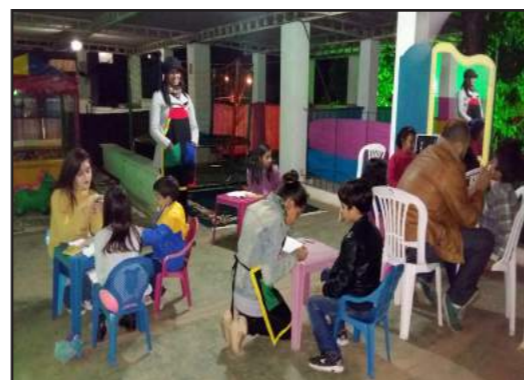
Espaço Infantil: A Espaço Baby garantiu a festa e o entretenimento de toda a criançada!