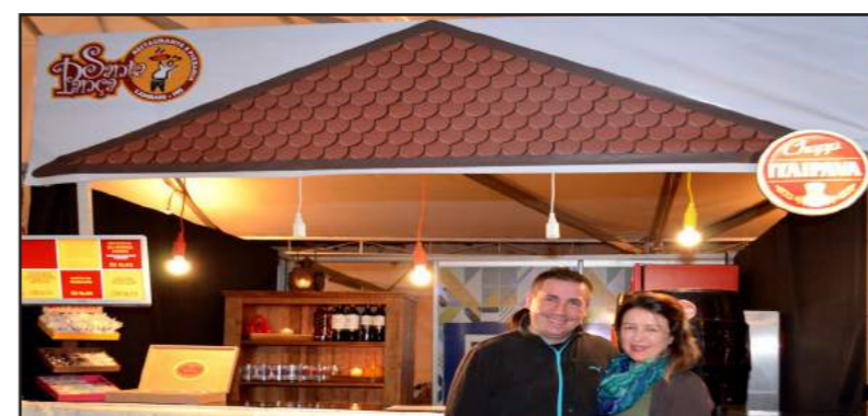
Restaurante Santa Pança: Ofereceu um cardápio variado que ia do Risoto de Bacalhau à Panceta Marinada na Cachaça ao Forno, acompanhado de Purê de Batata Doce, Virado de Escarola e Molho de Pimenta Biquinho, 4º prato mais votado pelo público do Festival.