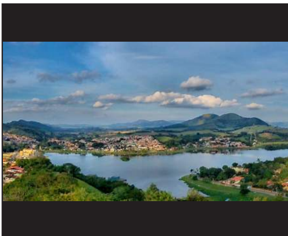
A Volta do Lago vista do mirante do Cruzeiro.