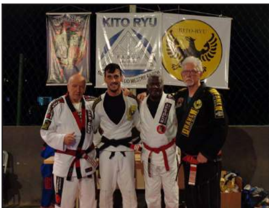
Os mestres da graduação na Kito Ryu

Praça Vivaldi Leite Ribeiro, 98 Lambari - MG (35) 3271-1848 (35) 9880-8886