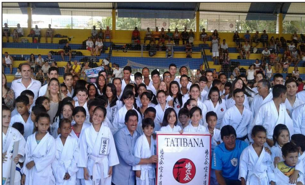
O prefeito Sérgio Teixeira prestigia o evento organizado pela Academia Tatibana.

No dia 06 de março, foi realizada a 1ª etapa do Campeonato Mineiro de Karatê Interestilos, organizado pela Federação Mineira de Karatê Interestilos e Academia Tatibana Lambari, contando com o apoio da Prefeitura Municipal e do público ali presente.