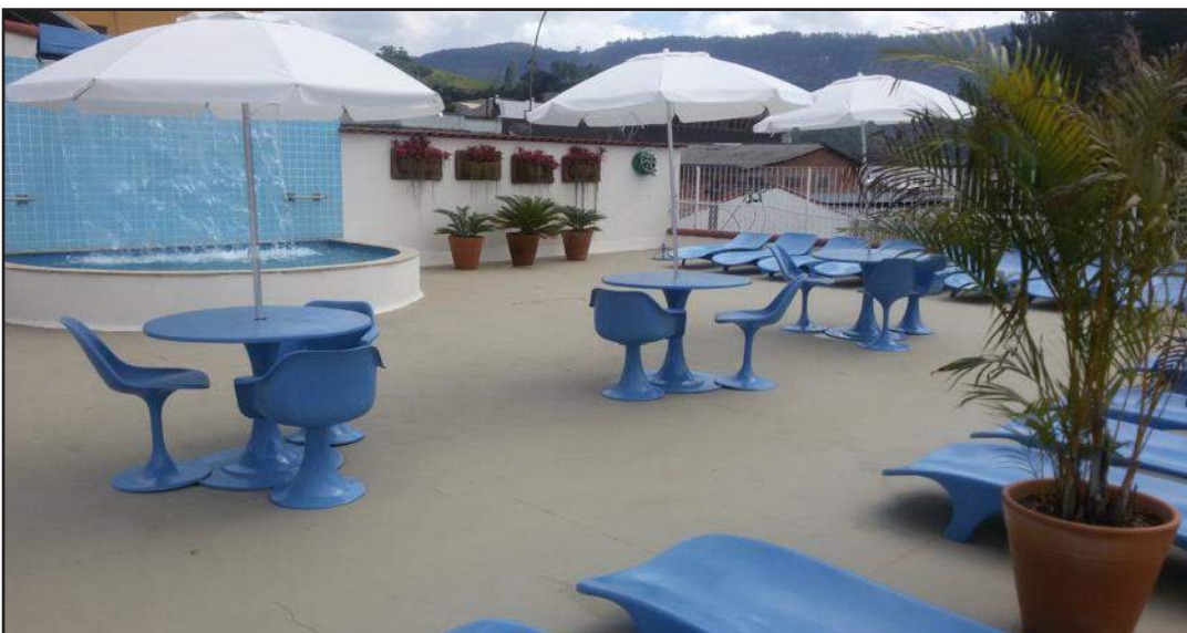
A área de lazer do Hotel Rezende, que além do conforto, proporciona aos hóspedes uma das melhores vistas da Serra das Águas e do Centro da cidade.

O setor, como um todo, aguarda por um plano de ações que vise de forma contundente resgatar o nome de Lambari como uma agradável estância turística que tanto nos orgulhou um dia.