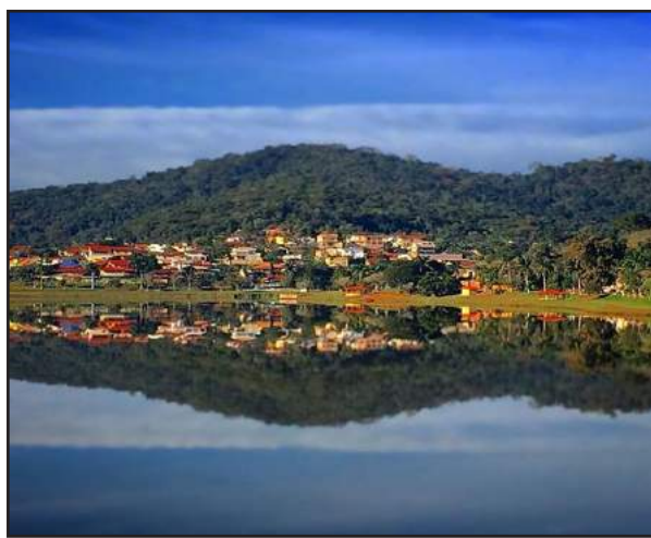
A pedido do nosso querido leitor, a beleza do Lago Guanabara