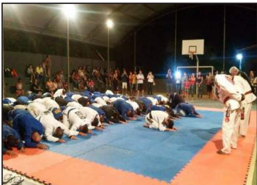
Os alunos que se dedicam à arte suave